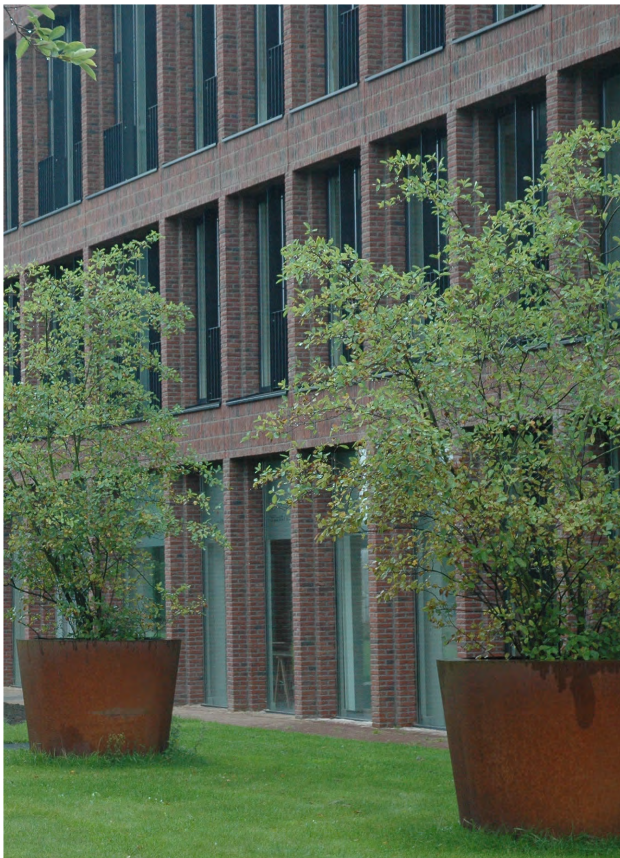
Tricot terrein Winterswijk