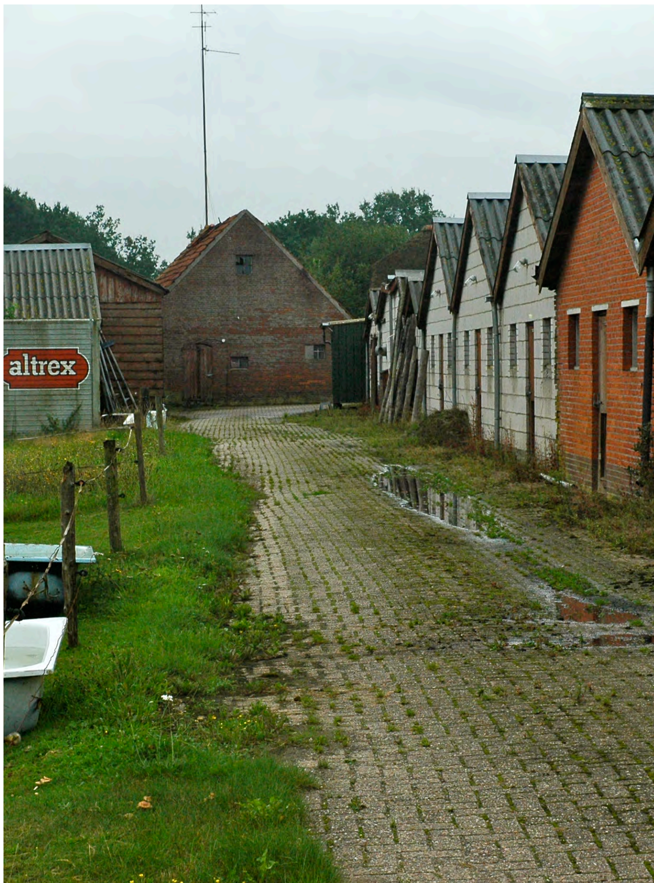
Erf met achterstallig onderhoud in Nunspeet