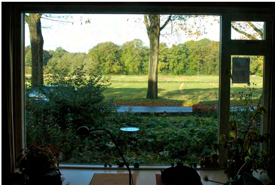
Zicht op de westelijke buitenlandgoederenzone vanuit een Renkumse huiskamer

De gemeente heeft aan haar west- en oostzijde groene randen, die de overgang vormen met de aangrenzende stedelijke gebieden. In de westelijke buitenlandgoederen liggen relictien van landgoederen en een kasteel, deze kunnen worden aaneengesmeed in een samenhangend parkbos. In de oostelijke zone (met o.a. Mariëndaal) wordt versterking van wellness en leisure mede richtinggevend.